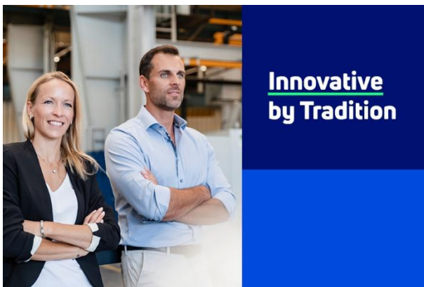
Personas en el centro e innovadores por tradición - la nueva reivindicación de PFERD TOOLS