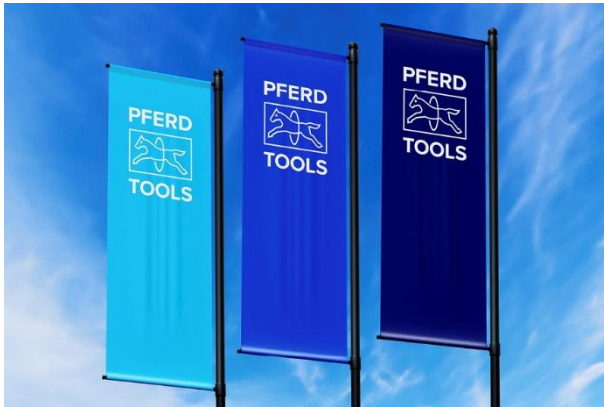
Colores frescos, logotipo modernizado, posicionamiento claro en el nombre: la nueva identidad de marca de PFERD TOOLS